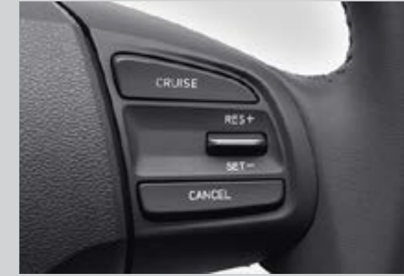
Điều khiển hành trình