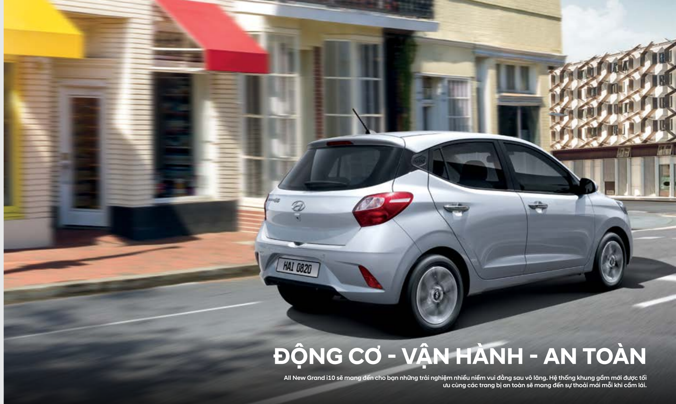
Được tối ưu để tạo nên sự cân bằng giữa niềm vui lái xe và khả năng tiết kiệm nhiên liệu