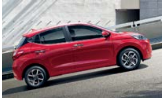
Hệ thống hỗ trợ khởi hành ngang dốc tích hợp với cân bằng điện tử