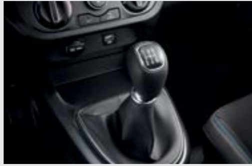
Hộp số sàn 5 cấp