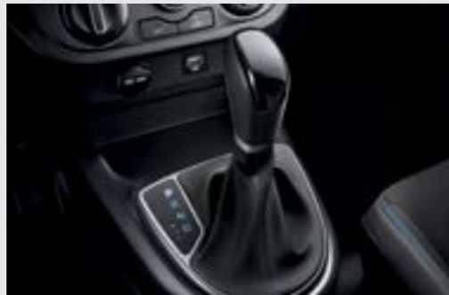
Hộp số tự động 4 cấp