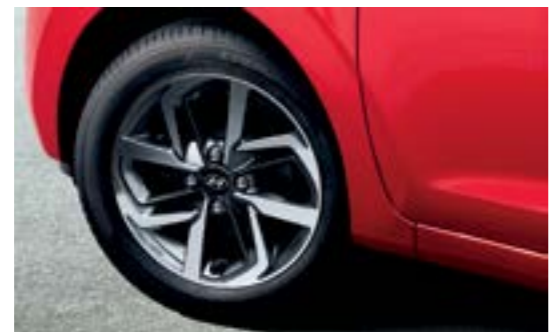
Hệ thống cảm biến áp suất lốp