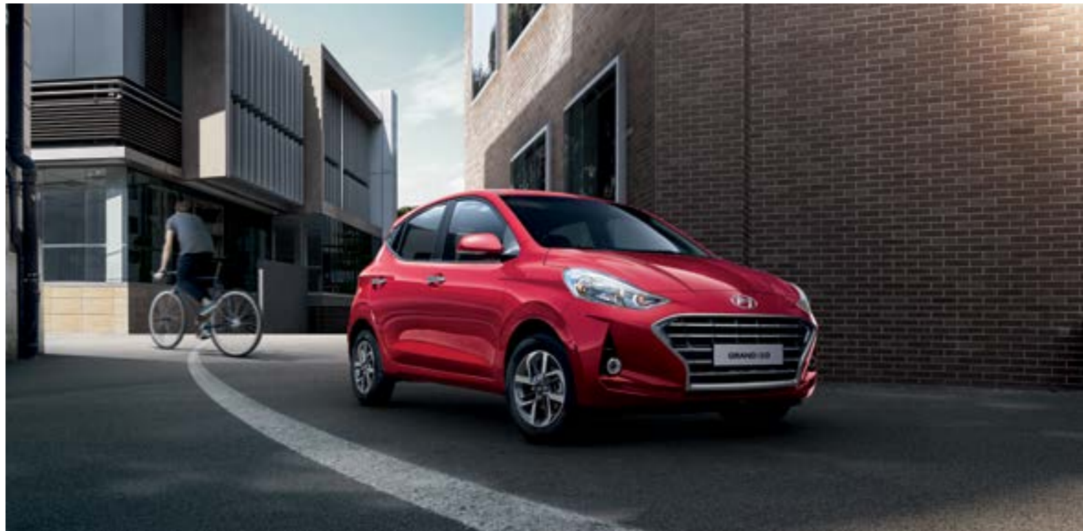
Tiên phong trong thiết kế với các đường nét thể thao, trẻ trung cùng mặt lưới tản nhiệt Crom tạo ra khí chất người dẫn đầu.