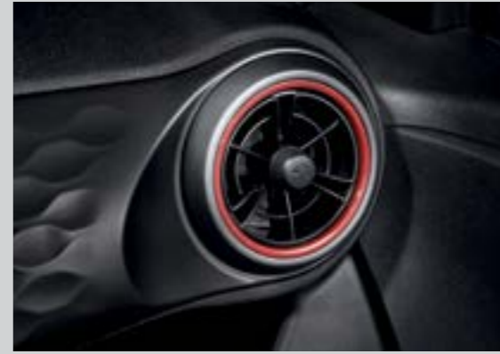
Cửa gió điều hòa dạng tua bin với 2 tông màu trẻ trung