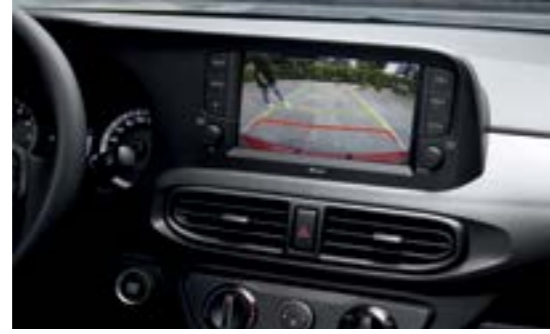
Camera lùi hỗ trợ đỗ xe