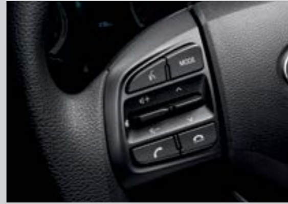
Cụm điều chỉnh media tích hợp nhận diện giọng nói