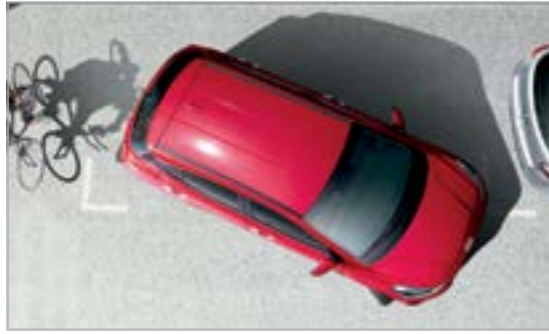
Cảm biến va chạm phía sau