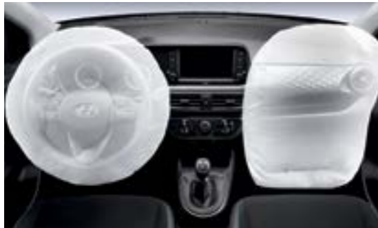
Hệ thống an toàn 2 túi khí